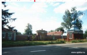
El Museo "El maestro de postas".

Esta es tierra del poeta ruso Pushkin. El museo fue fundado en 1972 en homenaje a su obra famosa "El maestro de postas" del libro "Relatos de Belkin". Este mismo lugar con los personajes de allí fue descrito en la obra. Es un hermoso museo literario que ha ganado varios premios mundiales.