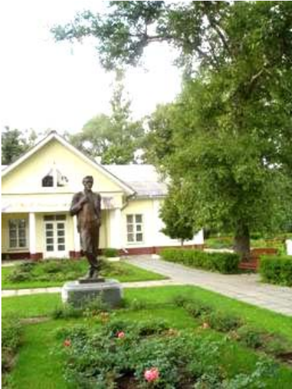
La casa de campo del escritor Anton Chéjov