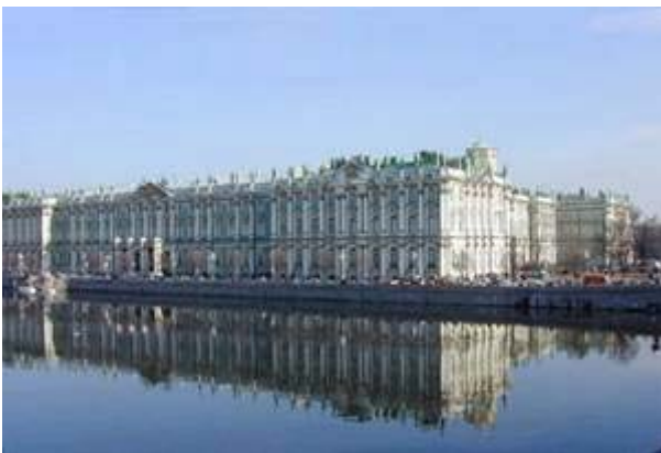
El Hermitage a orillas del Neva. Podíamos contemplarlo desde nuestro hotel.