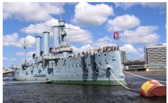
El acorazado "Aurora", que dio la señal para el comienzo de la revolución. Anclado permanentemente frente a nuestro hotel.