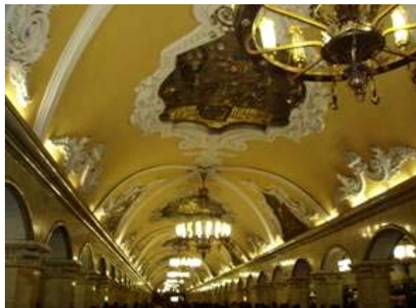
Una de las estaciones del metro de Moscú