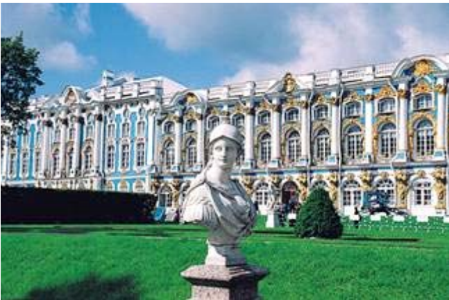
El Palacio de Tsarskoe Selo, residencia veraniega de Catalina la Grande