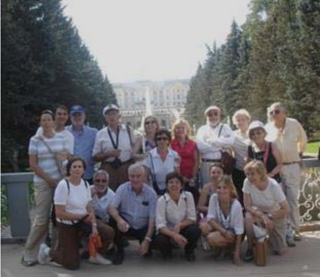
En el Palacio Versallesco de Pedro el Grande, a orillas del golfo de Finlandia