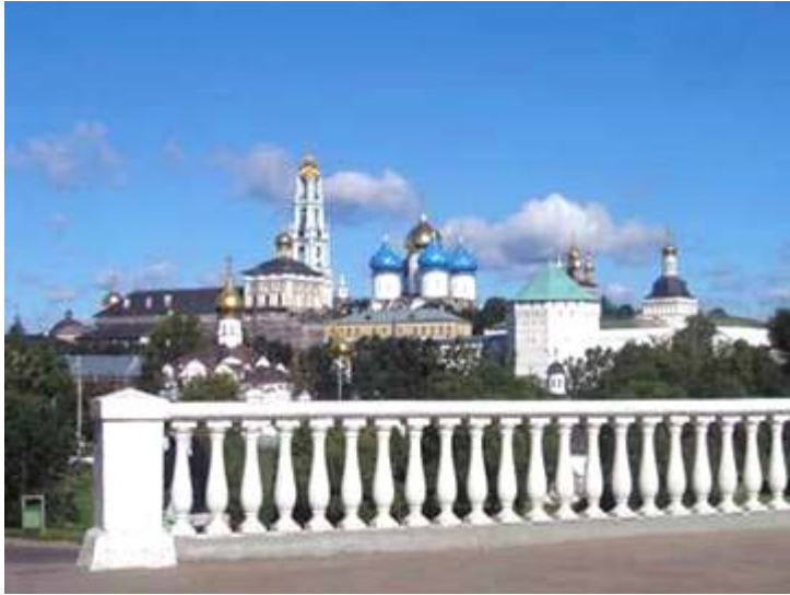
El monasterio Sergiev Posad, a 90 Km. de Moscú